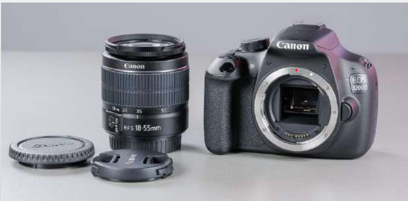
Фотоаппарат с объективом