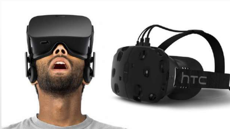
Шлем виртуальной реальности

Иммерсивные технологии — виртуальная и дополненная реальности — обеспечивают эффект полного и частичного присутствия человека в цифровом пространстве. Они формируют новый подход к контенту и впечатлениям. Многим знакомы VR-аттракционы, когда можно надеть специальные очки и почувствовать себя героем игры, пройти квест.