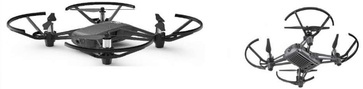
Квадрокоптер тип 2- DJI Tello EDU

Иммерсивное обучение – это метод, который использует искусственную или смоделированную среду, благодаря которой учащиеся могут полностью погрузиться в процесс обучения. Он не только устраняет отвлекающие факторы, но и убивает монотонность в процессе обучения и развития, обеспечивая стимулирующие визуализации. Иммерсивное обучение позволяет повысить вовлеченность учащихся и, следовательно, сделать обучение более продуктивным и ценным.